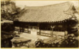
1900년 우정총국 전경