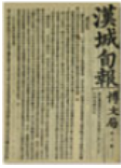
한성순보 <漢城旬報> 서양각국의 근대우정 현황을 소개한 기사