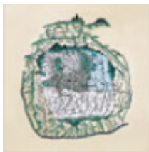
우정집신분전구역도 <郵政集信分傳區域圖> 1884년 우정업무 시작 초기의 서울안 우표판매소 및 구역을 표시한 지도